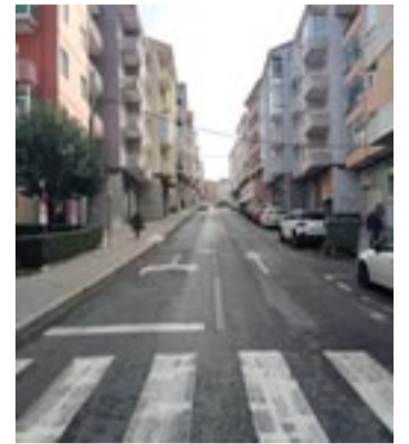
Rúa Vasco Díaz Tanco.

A actuación prevé a instalación de cinco ramplas mecánicas que salvarán a forte pendente existente nesta rúa, desde a súa parte inferior, na confluencia coa avenida de Zamora, até a zona máis alta, despois do centro de saúde de A Cuña-Mariñaman-