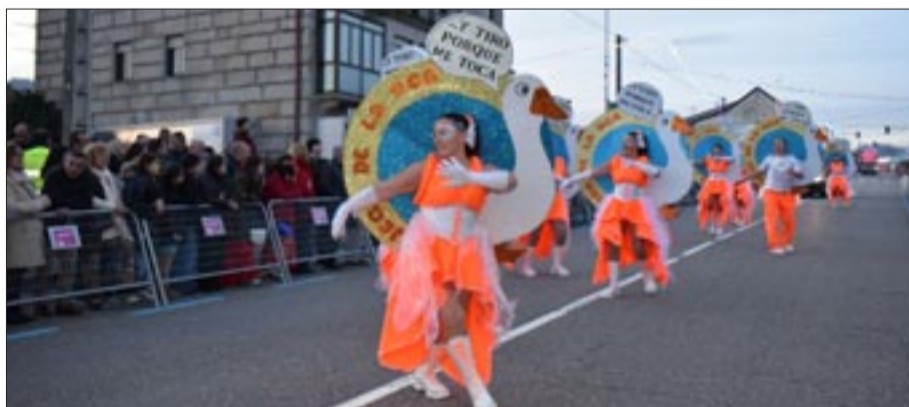
En Mos desfilaron pola Avenida de Sanguñeda