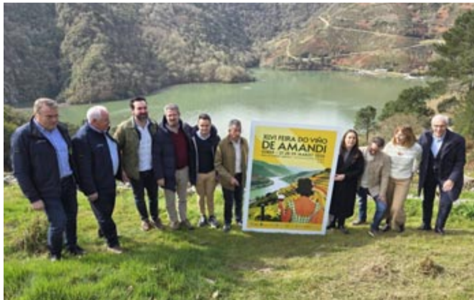
Presentación do cartaz no miradoiro do Xabrega.

Sábado 28, ás 11:00 horas, apertura de stands. Ás 11:30 horas, actuación dun