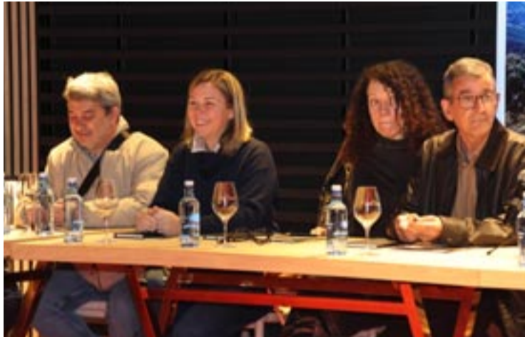
Xuntanza na Adegas Regina Viarum de Doade (Sober).

Celebrouse en Doade (Sober) unha xuntanza para facer seguimento do proceso para que a Ribeira Sacra sexa declarada Patrimonio da Humanidade. Na reunión expuxéronse as últimas xestións administrativas realizadas antes de que o Consello Internacional de Monumentos e Sítios, o ICOMOS, emitise o seu informe de avaliación. Explicaron que se abre unha fase de exposición "máis política" para dar a coñecer o proxecto entre os 21 países integrantes do Comité da UNESCO. Está previsto que a resolución das candidaturas a Patrimonio Mundial teña lugar en Busán, República de Corea, entre o 19 e o