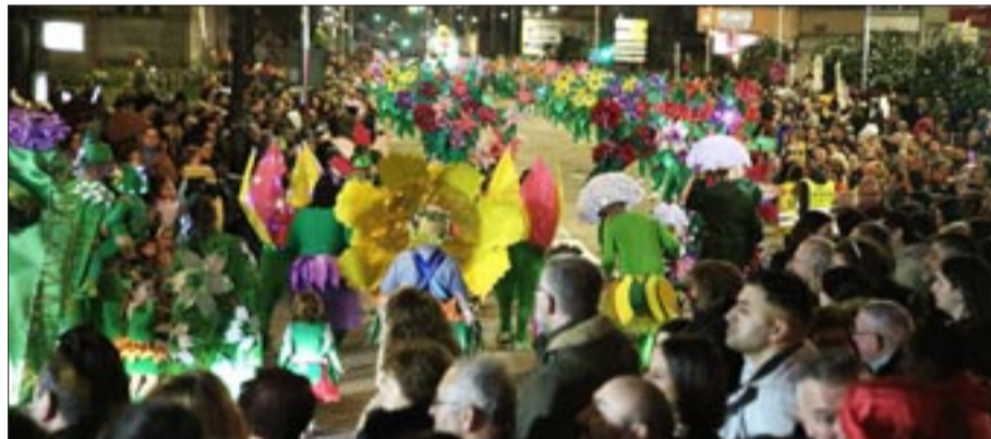
Cinco días de festa no Porriño.