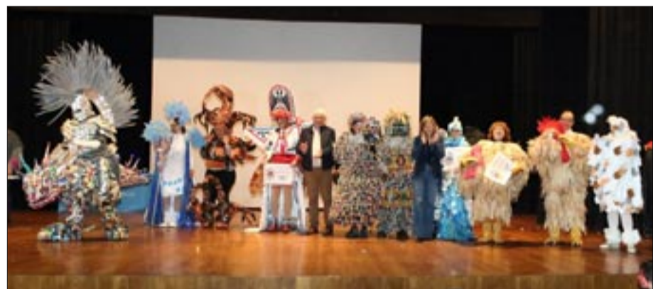
Música e cor nos disfraces en Ponteareas.