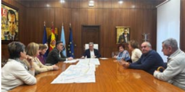
Directivos da asociación veciñal na Deputación de Ourense.

Durante a reunión, os representantes veciñais explicaron os problemas de estacionamento que van xurdir unha vez que se execute o proxecto de mobilidade vertical que, aínda que necesario, vai reducir o número de prazas de apar-