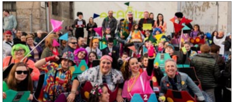
Na Cañiza, máis de 200 persoas participaron no concurso de comparsas.