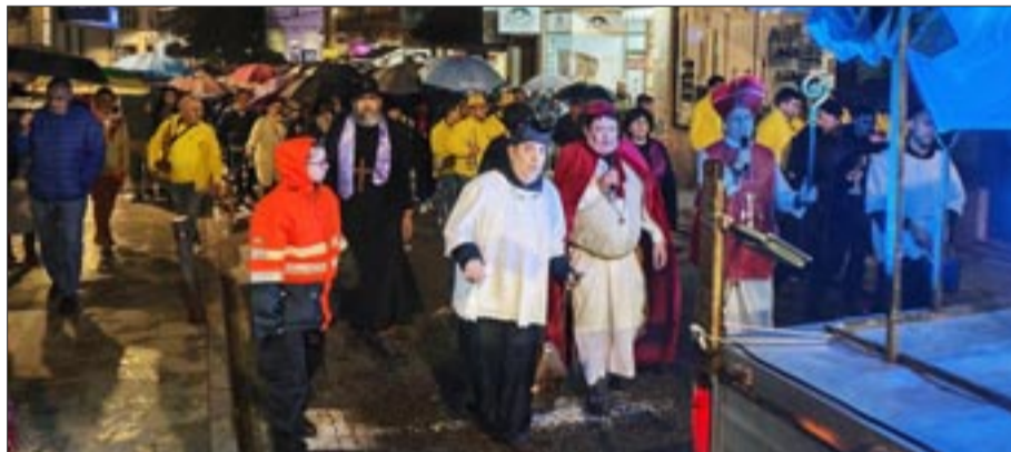
Entero da Sardiña en Ponteareas.

rolóxicas que durante máis 40 días caeron sobre os Concellos galegos. Non importa se o ceo estaba gris; os desfiles das comparsas, os disfraces, a música, a retranca e a gastronomía encheron de cor e ilusión, unha vez mais, ás rúas galegas.