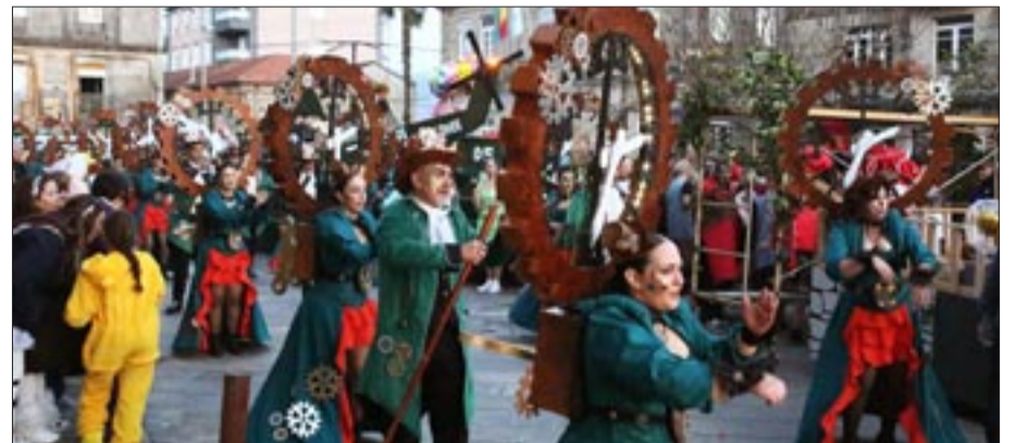
Desfile de Entroido en Arbo.