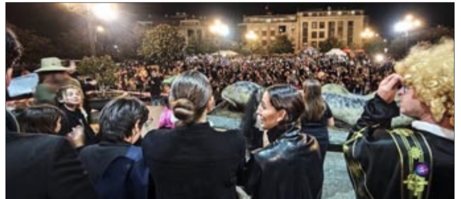
Entero da Lamprea na plaza do Concello de Salvaterra de Miño.