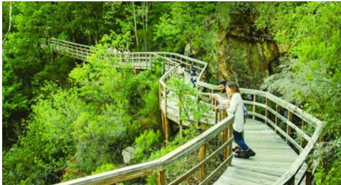
Pasarela sobre o río Mao.

Descendendo entre viñedos podemos facer un descanso no mi-