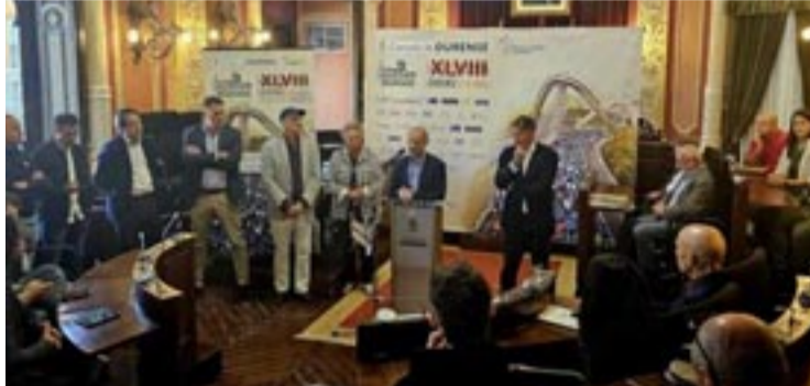
Presentación da carreira na Casa Consistorial.

Este ano o circuito se adapta a causa das obras que se están a executar na avenida de Portugal.