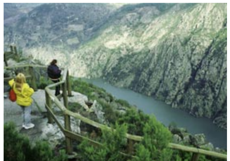
Mirador Balcóns de Madrid.

A Fábrica da Luz é unha vella central hidroeléctrica construída