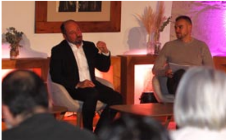
Foro Territorios celebrado en Monforte.

Así o puxo de manifesto durante a súa intervención no Foro Territorios Patrimonio 2025 que se desenvolve no parador de turismo de Monforte de Lemos e que reuniu nesta paraxe a representantes de institucións, comunidades locais, expertos e proxectos de referencia nacionais e internacionais baixo o lema 'Un