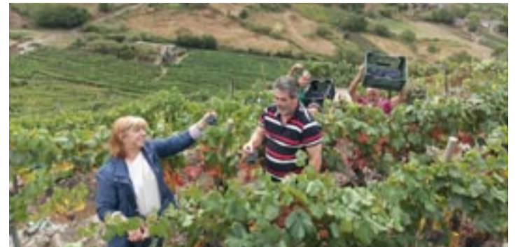
Vendimadores nos viñedos de Adega Vella en Abeleda, A Teixeira.

Na denominación de Orixe Ribeira Sacra, a data do 5 de outubro, recolléronse 4.588.133 quilos de uva, cun total de catro adegas activas, 79 finalizadas e cinco pendentes de iniciar o proceso. En canto a variedades, contabilízanse 3.536.323 quilos de uvas tintas, principalmente Mencía (3.183.589 kg), xunto con Merenzao, Garnacha e Brancellao. As uvas brancas alcanzan os 1.051.720 quilos, con predominio de Godello (914.101 kg), seguidas de Treixadura, Albariño, Branco Lexitimo e Doa Branca.