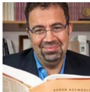
Daron Acemoglu, economista turco, Nobel de Economía 2024.