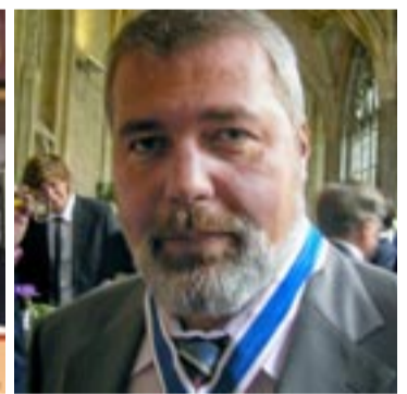
Dimitry Muratov, xornalista ruso, Nobel da Paz 2021.