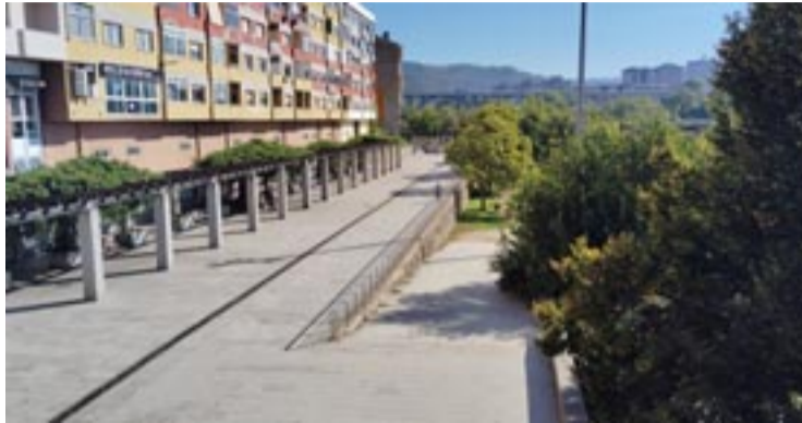
Parque Ribeira de Canedo na barrio de A Ponte.

O rexedor destacou que o Parque Ribeira de Canedo, xunto á Ponte Vella, “é un espazo precioso, que está no centro da cidade, na