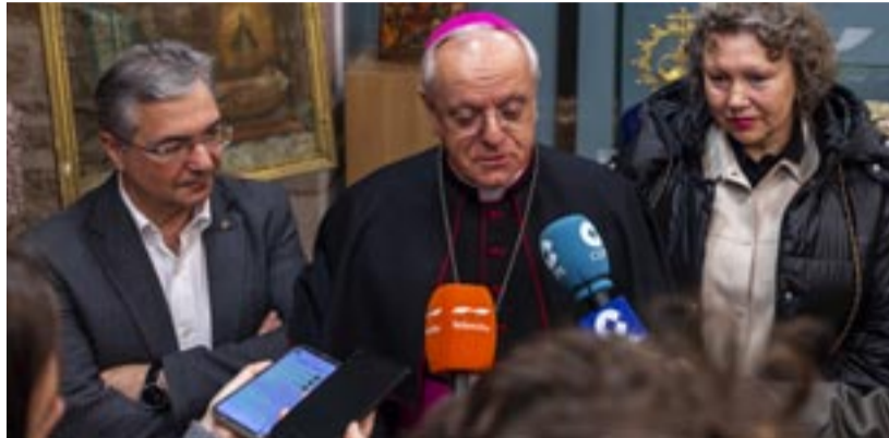
Momento da inauguración da exposición.