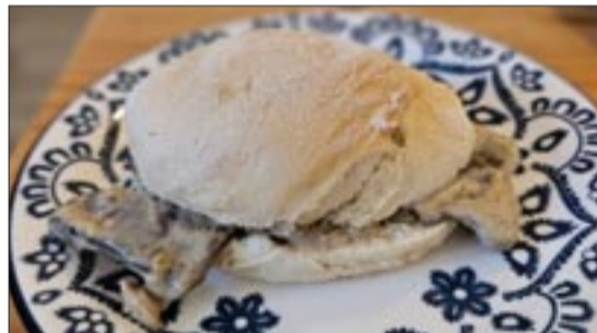
EL CORRAL. Xeitosiño de Primavera: Salsa de champiñóns con queixo roquefel.

San Francisco, Avenida de Buenos Aires, Zona Universitaria, A Ponte e Hospital. Os clientes que adquiren un petisco por tres euros, recibirán un ticket que será selado polo responsable do local. Ao conseguir catro tickets doutros locais diferentes procedese á elección do mellor petisco e a papeleta do cliente cos seus datos entrará nun sorteo que lle dará opción a recibir premios. Publicamos o nome do local., a denominación do petisco e a súa composición.