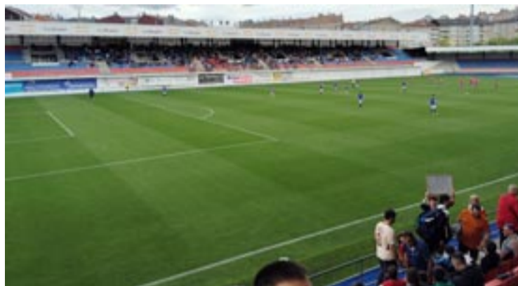
Encontro entre a U.D. Ourense e o Betanzos trala renovación do campo.

tacas, todas elas a cuberto, repartidas nas bancadas de Tribuna (1.811), Preferencia (2.231) e Fondo (1.617).