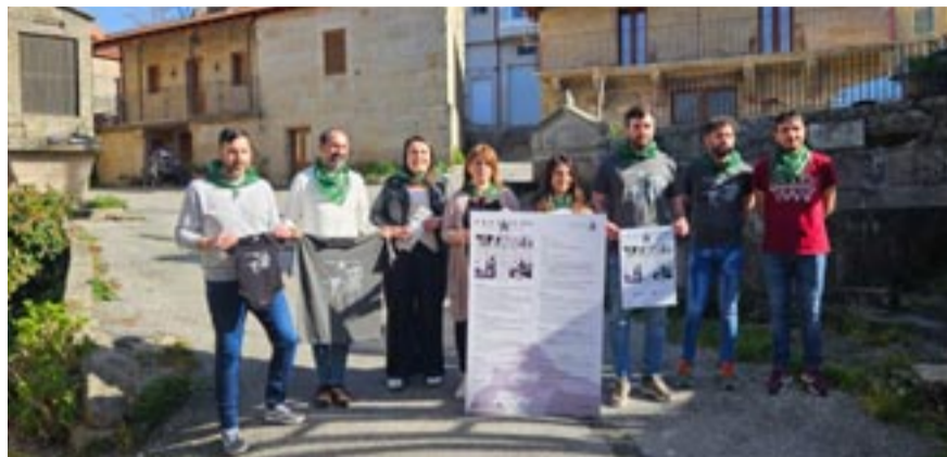
A organización presentando a festa 2024.

Pola tarde se fará unha presentación a cidadanía da programación, como ven sendo habitual. Así mesmo tamén non adiantou que despois do éxito acadado o ano pasado, o venres 29 de marzo o Campo da Barreira acollerá unha festa coa Discomóvil Apocalipse na que presentará a Festa a toda a mocidade local.