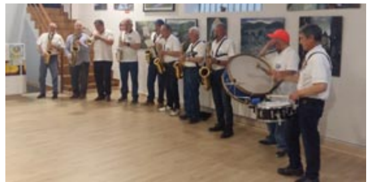
Grupo musical da Sociedade Albor do Couto.

A programación festiva inclúe as seguintes actuacións: xoves día 16 orquestra Gramola Horizón;