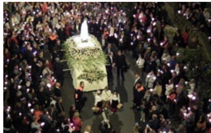
Procesión multitudinaria da Virxe de Fátima á saída do santuario.