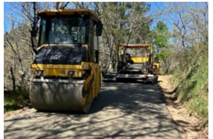
Actuacións en pistas do municipio.

Técnicos do Concello do Pereiro de Aguiar están a levar a cabo os traballos de renovación de sete pistas situadas en catro parroquias deste municipio: Covas, Santa Marta, San Xoán e Calvelle. Trátase de actuacións de mellora integral dos camiños que conectan distintos núcleos de poboación dentro do Concello. Consisten na aplicación dunha nova capa de rodadura e tamén perfilado e limpeza das cunetas en pistas agropecuarias.