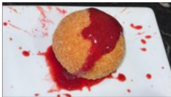
CASA CORTÉS. Xeito. Croqueta de pataca e torrezno de Soria, empanada en panko acompañada dunha salsa de froitos vermellos.