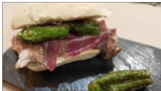
O CAPRICO. Serranito galego. Solomillo ibérico, xamón ibérico e pementos de Padrón.