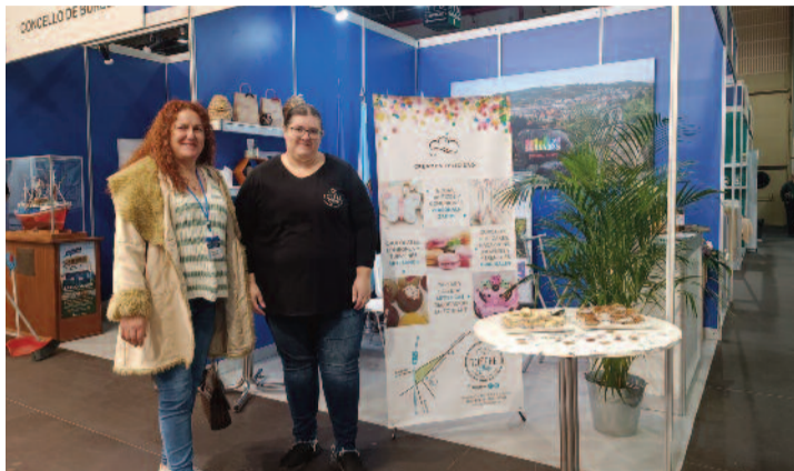
Stand do Concello de Barbadás.

Déronse a coñecer os produtos artesanais da empresa agroalimentaria Jofesa baixo a marca "Fit Fruit": cremas de cabaza, de verduras, de cenoria, de allo porro e de cabaciña. Tamén marmeladas cento por cento naturais: de ameixa vermella, de amorodo,