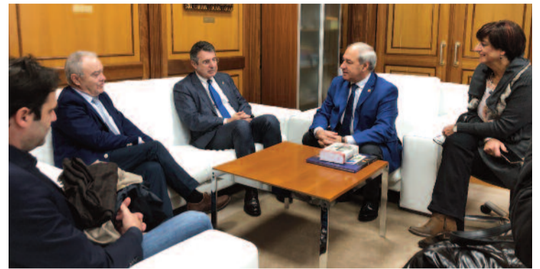
Encontro no consistorio de Monforte.

O presidente da Deputación de Huesca, e alcalde de Arén, reivindicou ademais a necesidade de “ampliar con más dotación presupuestaria los fondos desti-