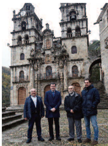
As Ermidas pertence á Diocese de Astorga.

O Goberno galego é a administración máis comprometida co patrimonio cultural galego, como así o demostra o incremento nos orzamentos do vindeiro ano do 14% nas contas destinadas á conservación, restauración, investigación e