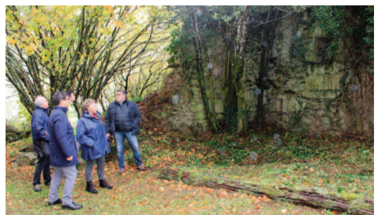
O que fora mosteiro dúplice hoxe está ruinoso.

Realizarase unha prospección arqueolóxica do sitio histórico e do seu entorno inmediato para identificar e determinar a súa configuración espacial e os seus elementos principais e farase un inventario das estruturas arquitectónicas existentes e dos ele-