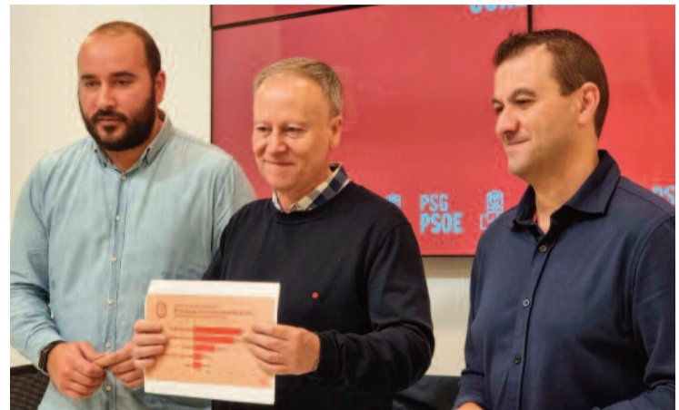
Rolda de prensa do PSdeG de Ourense.