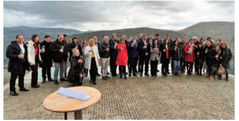
A sinatura do protocolo realizouse en Doade (Sober).

O proxecto da Rede de Cruceiros Costeiros e Fluviais dos Destinos Náuticos Sostibles de España implantarase en nove comunidades autónomas: Galicia, Estremadura, Castela e León, Aragón, País Vasco, Cataluña, Andalucía, Canarias, Baleares; e Ceuta, e será