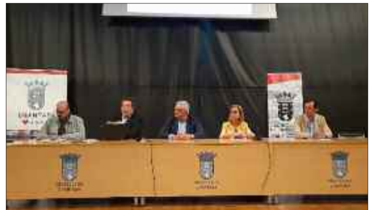
Charla informativa presidida polo alcalde de Chantada.

Este proxecto enmárcase dentro do chamado Plan de acción estratéxico para a Ribeira Sacra, un conxunto de medidas que impulsou a Consellería de Medio Ambiente, Territorio e Vivenda en setembro