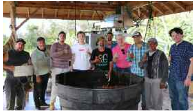
En Termatalia poderase tomar cafés de 30 países produtores.

Grazas á acción combinada dos delegados internacionais que conforman a "rede Termatalia" (a feira conta cunha vintena de delegados internacionais que cobren máis de 40 países) e a dos colaboradores de alternative. cafe,