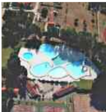
Complexo deportivo de Monterrei.

Por outra banda, o rexidor municipal asegura que “as nosas piscinas municipais, sitas na Veiga de Abaixo, están listas para a súa apertura o que será efectivo nos vindeiros días unha