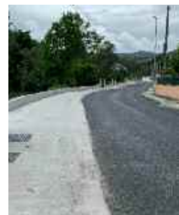
Ampliación da calzada.

lloras dende hai unhas dúas semanas esta obra é un realidade e melloría do servizo é moi notoria para todos os que a usan diariamente” indica o alcalde. “Boa parte do seu percorrido esta moi preto da ruta dos muíños do Loña a que se pode acceder en varios puntos da mesma o que constitúe un atractivo máis”, recorda o rexidor.