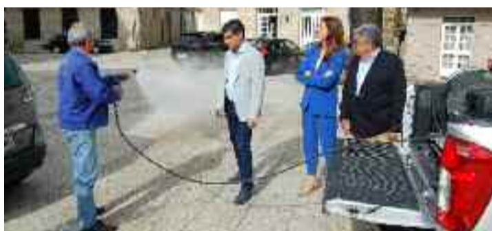
O vehículo presentouse na Praza Maior da localidade.

O Concello xustificou a súa adquisición na necesidade de coidar e protexer o patrimonio natural dun municipio que conta cun espazo incluído na Rede Natura como é Pena Veidosa. Ade-