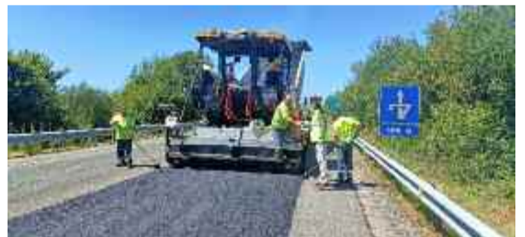
Ofrecense carrís alternativos para a circulación.

A Consellería de Infraestruturas e Mobilidade inviste 165.300 euros nas obras de mellora que acaba de iniciar na vía de altas prestacións CG-2.1, no treito entre Chantada e o Alto do Faro. Os traballos consisten no reforzo localizado do pavimento entre os puntos quilométricos 29+450 e 43+050.