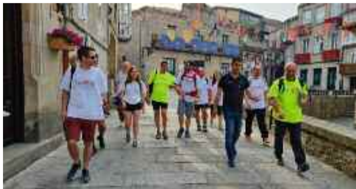
Camiñantes por Allariz.

Os retos que se propoñen acadar nesta ocasión están en liña cos Obxectivos de Desenvolvemento Sostible (ODS). Na etapa desenvolveuse o enun-