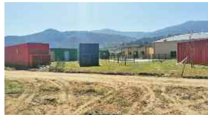
Quedará unha esplanada libre para futuras ampliacións.

Comezaron as obras do plan hurbe da Xunta de Galicia para rematar definitivamente as instalacións do xeocamping de Ribas de Sil. Estas últimas obras consistirán na construción dos viais interiores en zorra con bordillo de tacos de lousa, aporte de terra vexetal e instalación de regadío automático nas zonas verdes, iluminación, sinalización, área de servizos para autocaravanas, aparcadoiro de vehículos, delimitación de parcelas de acampada, mobiliario