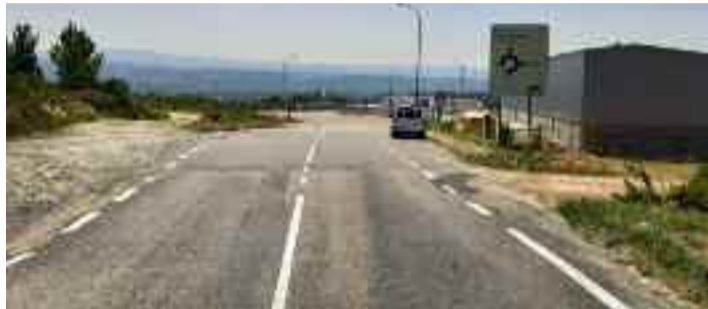
Vía de acceso principal ao parque empresarial.

Por outra banda, a Xunta concede unha subvención para mellorar o acceso noroeste ao parque empresarial do Pereiro. A actuación discorre no tramo que pertence íntegramente ao Concello, dende a urbanización de Monterrei ata a primeira rotonda do parque. As obras consistirán en renovar servizos, recollida e canalización de augas pluviais, construción de beirarrúa así como alumbeado no mesmo e nova capa de firme en todo o tramo afec-