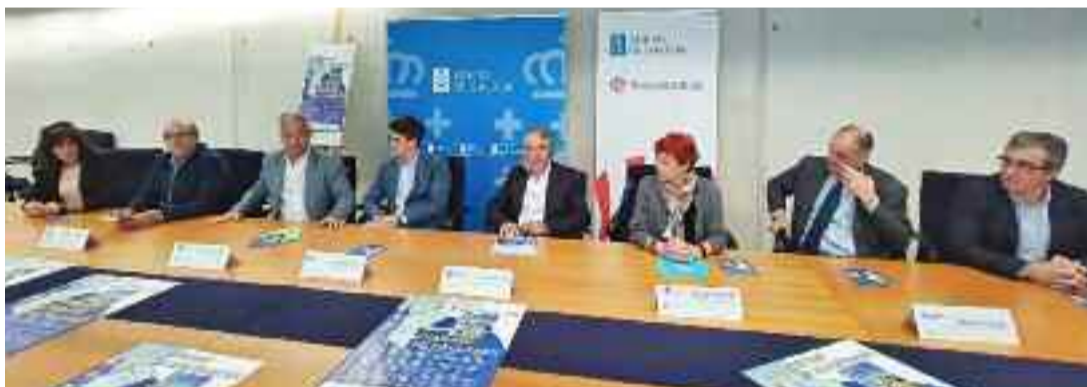
O prazo de presentación estará aberto ata o 30 de setembro.

A XVI edición do Certame de investigación Condado de Pallares, que convoca a Asociación de Amigos do Mosteiro de Ferreira de Pallares e conta co apoio da Consellería de Cultura, Educación, Formación Profesional e Universidades, presentouse en Lugo.