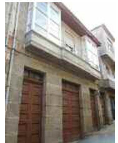
Edificio da rúa Cervantes de Ribadavia.

Os sete edificios que se van rehabilitar en Ribadavia foron adquiridos cun investimento total de 354.829 euros, dos cales 37.798 euros destináronse á com-