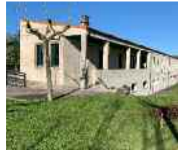
Próxima apertura do centro de día.

O alcalde asinou coa Consellería de Política Social o convenio que permitirá financiar a apertura do centro de día e desenvolver un programa importante na mellora da calidade de vida dos maiores: un programa integral de envellecemento activo e prevención de dependencia altamente beneficioso que vai a culminar un longo proceso e completar a carta de prestacións as persoas maiores para que acaden a mellor calidade de vida