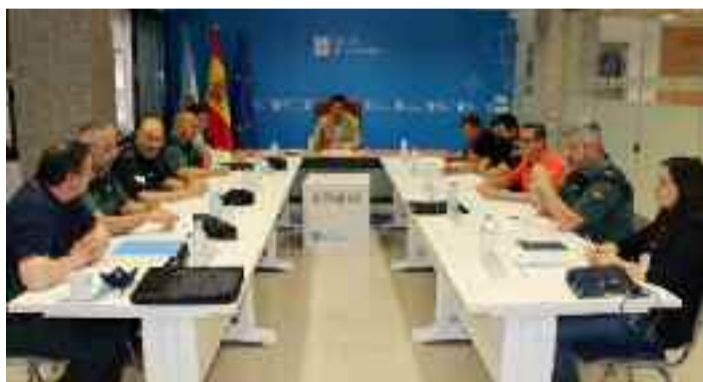
Constitución da comisión provincial.

Na reunión tamén participaron membros da Xefatura Territorial de Medio Rural, representantes da Subdelegación do Goberno, da Deputación da Federación Galega de Municipios e Provincias, e responsables da Policía Autonómica e Nacional e da Garda Civil. Presentáronse os distintos medios cos que se contará así como a competencia que terá cada un deles a través