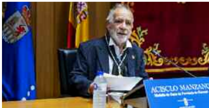
Intervención do escultor homenaxeado.

O homenaxeado referendou ese sentimento afirmando que “son de Ourense e nacín nas Burgas; máis non podo pedir”, engandido que abonda con mirar cara Montealegre ou a Ribeira Sacra para comprobar que xa temos todo aquí, as formas, a paisaxe, a escultura e a pintura, sen necesidade incluso de saír de Galicia”.