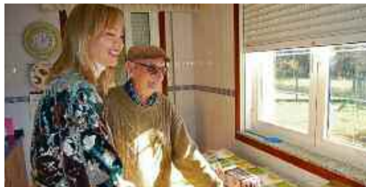
Un servizo imprescindible no Pereiro.

F ai dous anos, coa pandemia, o Concello do Pereiro puxo en marcha o servizo “xantar na casa”, “da man da Xunta de Galicia que nos prestou unha axuda extraordinaria. Tiñamos a idea de facelo, pois era un dos nosos obxectivos, pero a Covid -19 forzou a implantalo e o resultado non puido ser mellor” recorda o alcalde. Dende ese momento moitas familias gozan deste servizo ao que xa non poderían renunciar. “Somos un dos