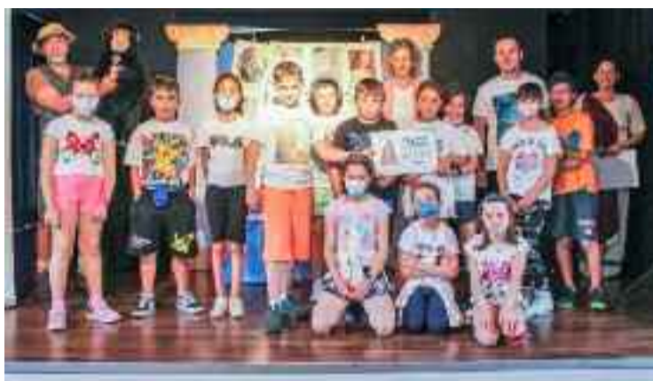
Alumnos premiados no Concello de Barreiros.

Este certame pretende difundir o cooperativismo entre o alumnado dos centros de educación infantil, primaria, secundaria, educación especial, formación profesional e ensinanza de réxime especial de Galicia, impulsando a