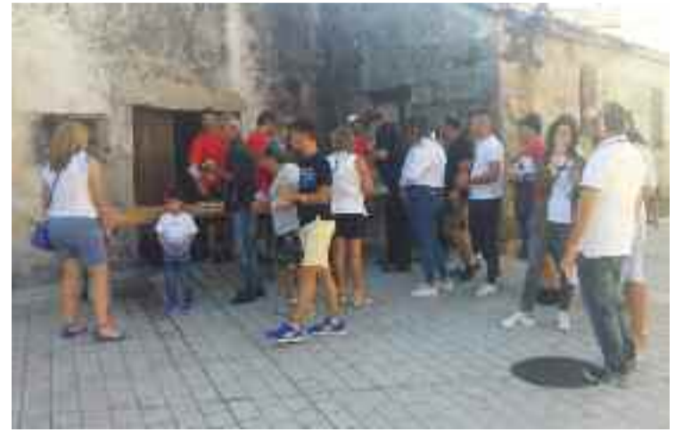
Por 10 euros os asistentes degustaron os produtos no exterior de 6 fornos tradicionais.

A programación comezou o día 2 de xullo, coa celebración de diversos talleres que versaron sobre o complexo proceso de elaboración do pan e de aqueles produtos gastronómicos que teñen como base este alimento. Ese sábado, de seis a oito da tarde, foi a Ruta dos Fornos. Os asistentes percorreron seis fornos antigos, que non están en uso, e no exterior degustaron bebidas e petiscos sobre todo empanada elaborada co mesmo pan de Cea. A animación musical da ruta correu a cargo das agrupacións Charanga CLK, Candaíra, Feitizo de Pau, Pandereiteiras de Cea, Pandereiteiras