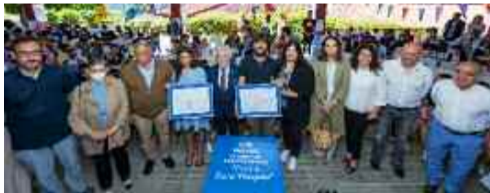
Foto de familia no colexio Virxe da Saleta de Cea.