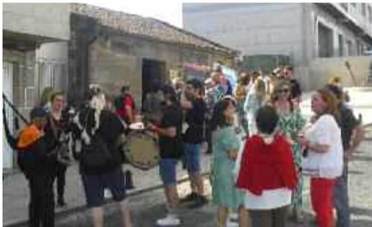
As charangas animaron ó público nos seis fornos da ruta.