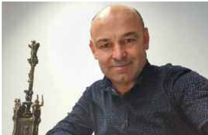
Pablo Castillo Alcalde de Covelo

“Maximizamos a dimensión social dos orzamentos”