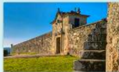
Capital histórica do Condado