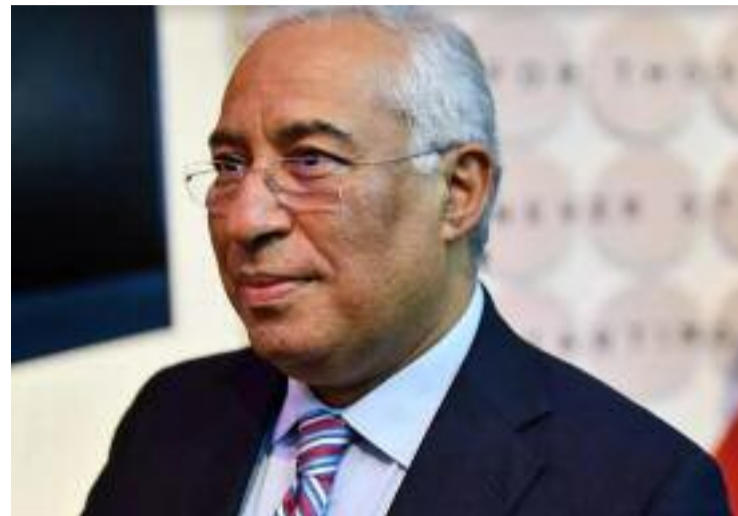
António Costa, Primeiro Ministro de Portugal.

Así, Visão suscribiu as declaracións do ministro de Economía, Pedro Siza Vieira: "Nós precisamos de eleições, se for essa a decisão do senhor Presidente da República, o mais rapidamente possí-