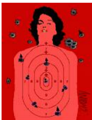
"Escuela de tiros para esas ratas cobardes"