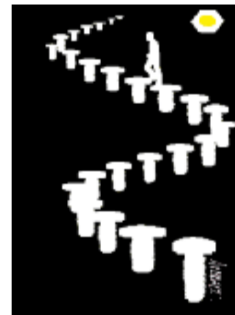
"No me falta un tornillo solo busco mi tuerca"