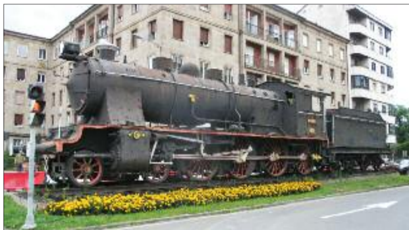
Os socialistas consideran "indecente" que se deixe perecer un símbolo do ferrocarril.

Os socialistas defenden o "valor cultural e histórico" do monumento que xa é un emblema da Ponte e da cidade. Por elo consideran "indecente" que se deixe perecer un símbolo da chegada e