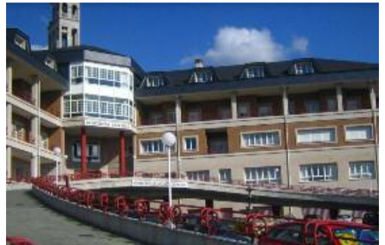
Residencia de anciáns San José, no barrio de Rairo.

Polo que puido saber o BNG, as votantes, con capacidades físicas mermadas, acudiron a través de vehículos levadas por profesionais da residencia. O BNG fixo constar na propia acta da mesa electoral esta práctica e as matriculas, así como outras que se