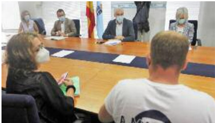
Xuntanza do comité de Alcoa.