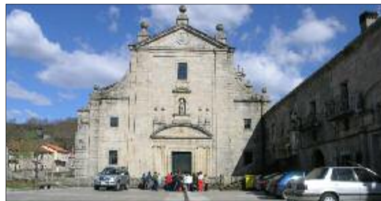
Mosteiro de Santa María de Montederramo. (Ourense).