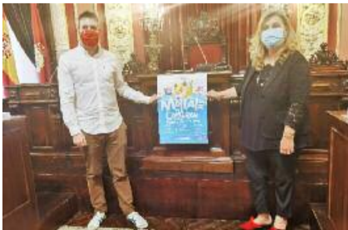
Acto de presentación da campaña.

O parque do Barbaña, o xardín do Posío, A Ponte, A Farixa,