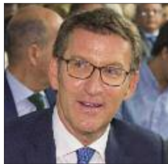
Alberto Núñez Feijóo, cabeza lista do PPdeG por Pontevedra.