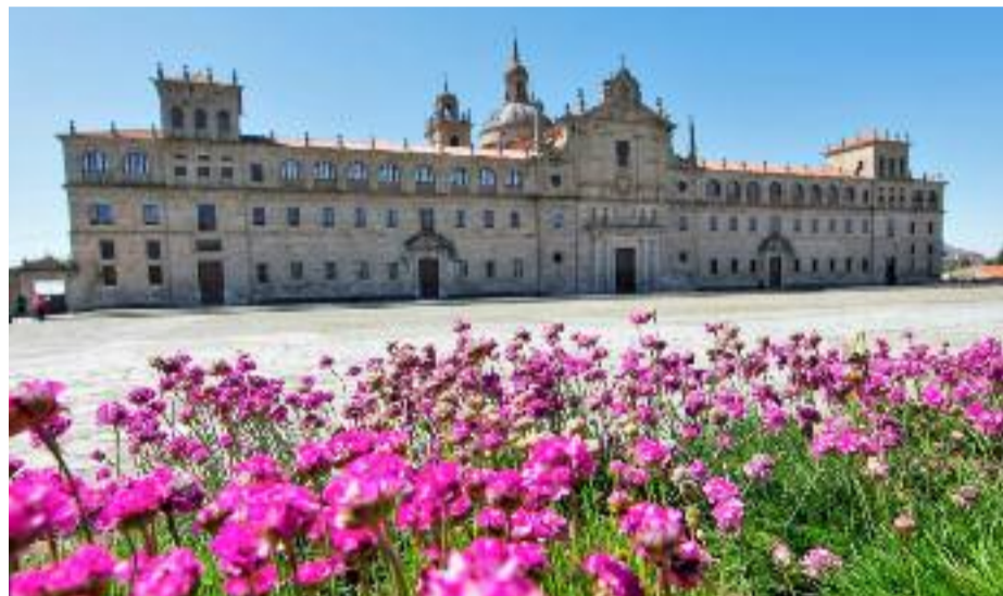
O monumento está en proceso de ser declarado ben de interese cultural.

A construción do Colexio da Nosa Señora da Antiga comezouse a finais do século XVI por iniciativa do cardeal de Sevilla don Rodrigo de Castro, para que, rexentado pola Compañía de Xesús, servira para a educación da comarca e de toda Galicia. Os biógrafos do Cardeal descríbennos como un humanista refinado, amante da arte e