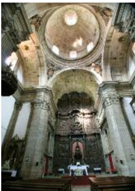
As obras terán unha duración máxima de seis meses.

traballo da Xunta de Galicia con vistas a reforzar a Candidatura da Paisaxe cultural da Ribeira Sacra a Patrimonio Universal, a un ano vista da súa presentación, estudo e debate no seo da 45ª sesión do Comité do Patrimonio Mundial da UNESCO.