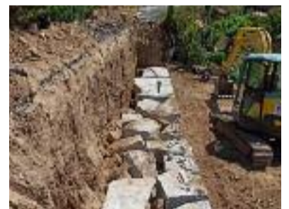
A rúa do Hórreo está no barrio da Carballa.