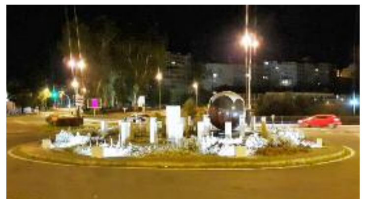
Glorieta da rúa Pardo de Cela.

O Concello de Ourense termina as obras de mellora e renovación da iluminaria da glorieta de Pardo de Cela, que inclúe un moderno sistema de iluminación na súa fonte. A actuación realizada consiste na implantación dun moderno sistema de iluminación na súa fonte, de 8 proxectores de 50 w, moito máis eficientes, que substitúen aos anteriores de 150 w, cos que se consegue unha maior