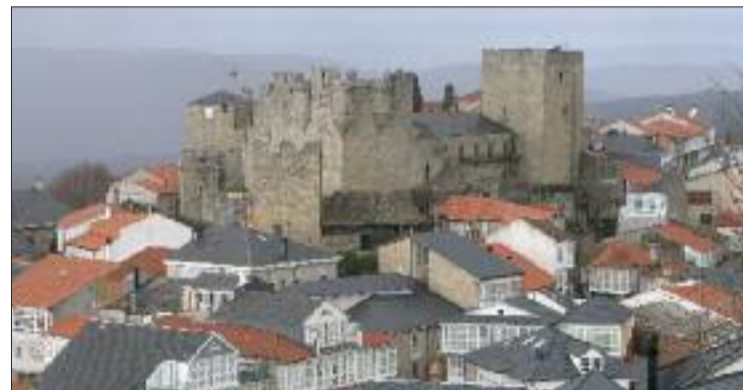
Castelo de Castro Caldelas (Ourense).

A comisión estará presidida polo titular da consellería competente en materia de patrimonio