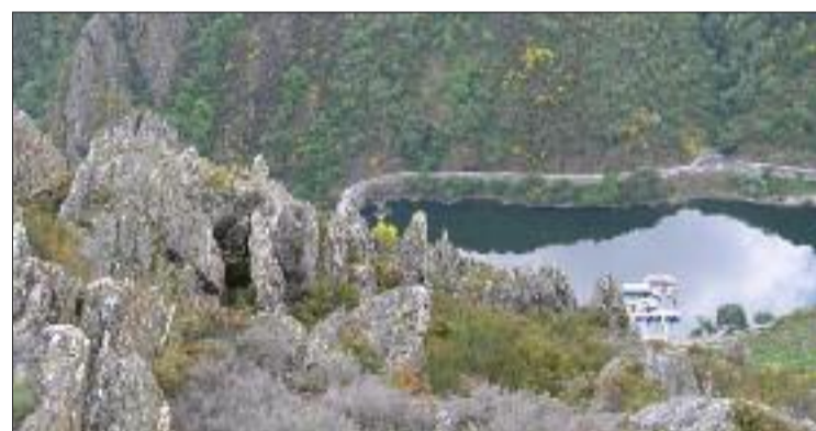
Río Sil desde o miradoiro do Duque, en Monforte.