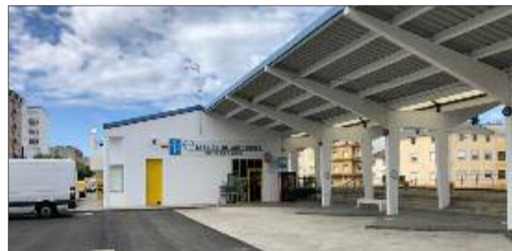
Colocarónse novos bancos e pantallas informativas electrónicas.

A Consellería de Infraestruturas e Mobilidade vén de rematar as obras de mellora e modernización da estación de autobuses de Burela, ás que destinou un orzamento de 72.000 euros. Os traballos realizados supuxeron unha significativa mellora da cuberta, tanto da dársena como do propio edificio; así como a renovación da rede de recollida de augas pluviais. O proxecto tamén incluíu o pavimentado da zona de circulación dos autobuses, que presentaba deterioro nalgúns puntos.