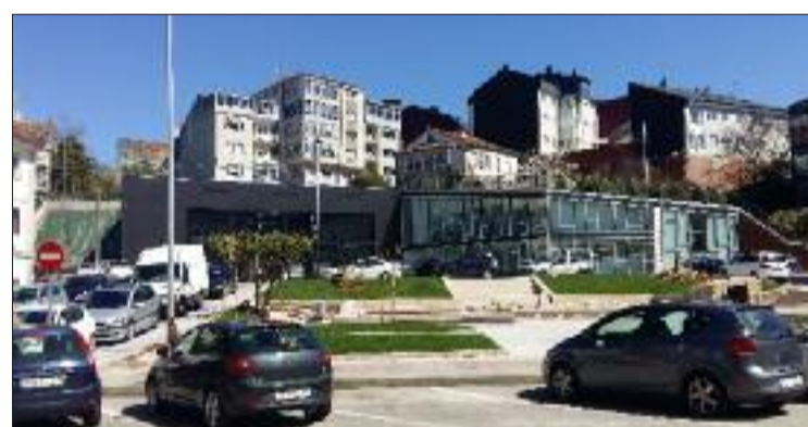
Chantada, corazón da Ribeira Sacra.

cultural e contará con dúas vicepresidencias primeira e segunda, que lles corresponderá ás persoas titulares da dirección xeral competente en materia de patrimonio cultural e turismo, respectivamente. Finalmente, as vogalías