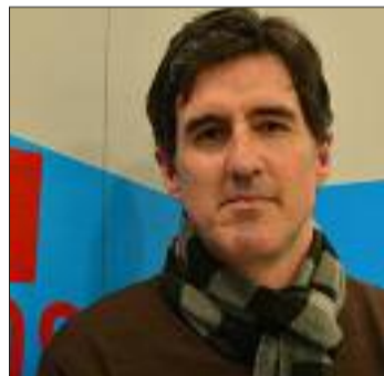
Pablo Arangüena, cabeza de lista do PSdeG pola Coruña