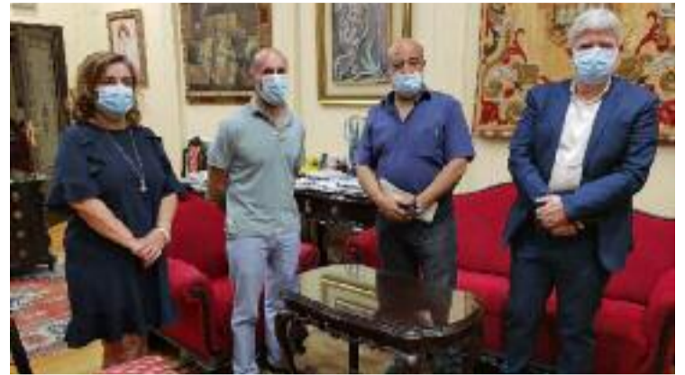
A reunión celebrouse na Alcaldía de Ourense.