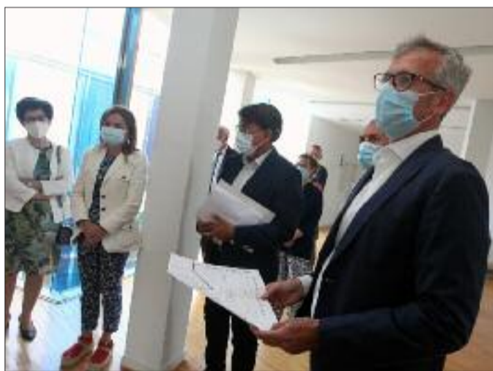
Os 4 xulgados do Social estarán no edificio da rúa Armando Durán.

Segundo explicou Alfonso Rueda, trasladarase o Xulgado de Menores para a Audiencia onde