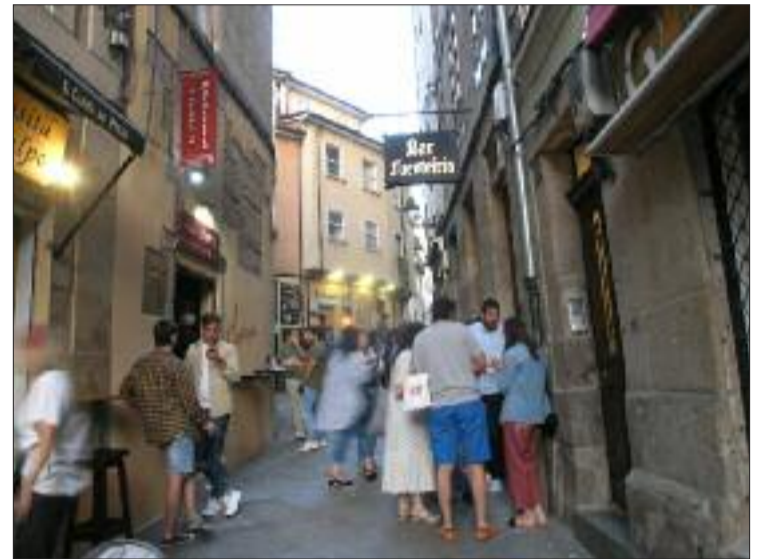
Bares na Rúa Viriato de Ourense.

A representación municipal comprometeuse a estudar as peticións dos hostaleiros, esgrimindo que se trata dun asunto transversal entre as diferentes concellerías, garantindo en todo