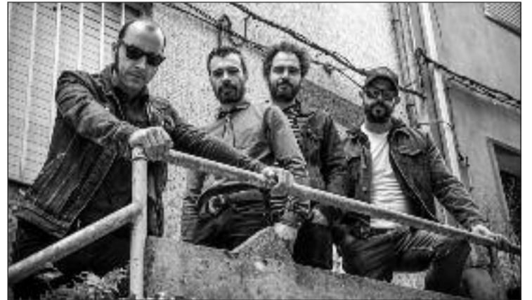
The Pretty Shirt actuarán na Guarda o 12 de outubro.

Todos os eventos comezarán a partir das 20.30 horas e contarán coa presenza e participación confirmada das adegas Quinta de Couselo e Terras