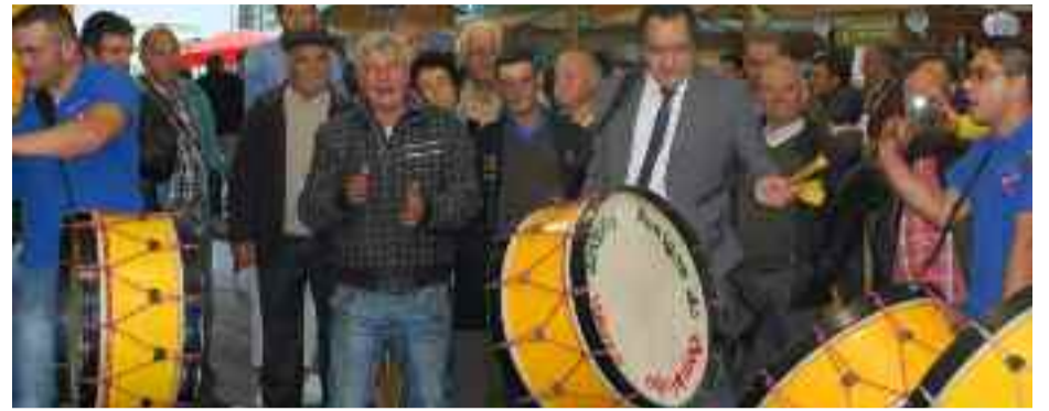
Um sábado con chuva dispersa, ora amena ora intensa, e un domingo solarengo, trouxeram moitas persoas à 6ª Feira do Vinho Tinto de Tangil.