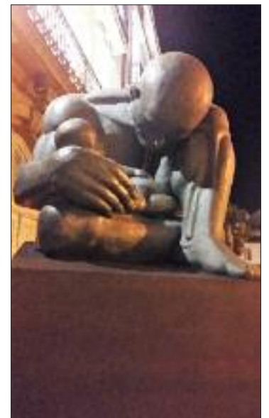
Obra de Ramón Conde na entrada ao centro cultural.

Normalmente, na súa obra, poden observarse “dúas personaxes emblemáticas: un é o tipo de figuras gordas moi características miñas, e outro máis musculoso que se desenvolve despois pero que é complementario incluso, as veces, parece a mesma personaxe”, sinalou Ramón Conde, quen engadiu que practicamente toda a súa traxectoria está “determinada por estas dúas personaxes que ata certo punto son a mesma. Nun son claramente masculinos e, no outro, roza o tema da ambigüidade, poden ser masculino, feminino ou unha mestura de ambas”.