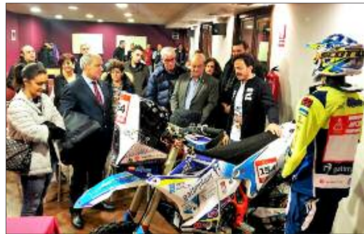
Recepción no Centro do Viño de Monforte.

Á cita Eduardo Igrexas acude logo de adestrarse intensamente nas áreas de Marrocos, participando en abril na "Mo-