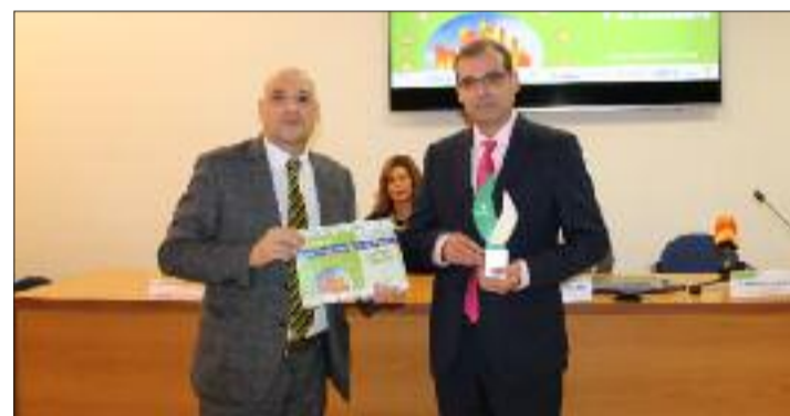
Premio para Cafés Lisboa.

Calidade 4.0 foi o lema do Día Mundial da Calidade 2019 que se celebrou o 7 de novembro e que. Expourense conmemorou organizando unha xornada de exaltación e entregando os IX Premios "Líderes en Calidade" a empresas e institucións galegas recoñecidas por ser un modelo a seguir nos seus respectivos sectores e das que destaca o seu compromiso coa calidade e co medio natural.