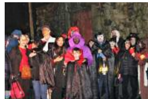
Unha das imaxes do Samaín en Loiro.

"O Samaín é unha celebración celta. Neste día, os defuntos terían a autorización para camiñar entre os vivos. Algúns vivos, pensaban que a visita dos defuntos era unha celebración e deixaban o lume aceso toda a noite e ata deixaban unha cadeira baleira con servizo e comida para que os espíritos se achegasen. Outros pensaban que podía ser un perigo e, para protexerse, colocaban caveiras cunha chama prendida en sebo nos muros das casas", explica Fernández.