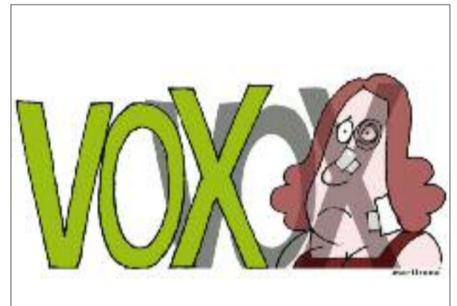
VOX dinamita o consenso das institucións contra a violencia de xénero