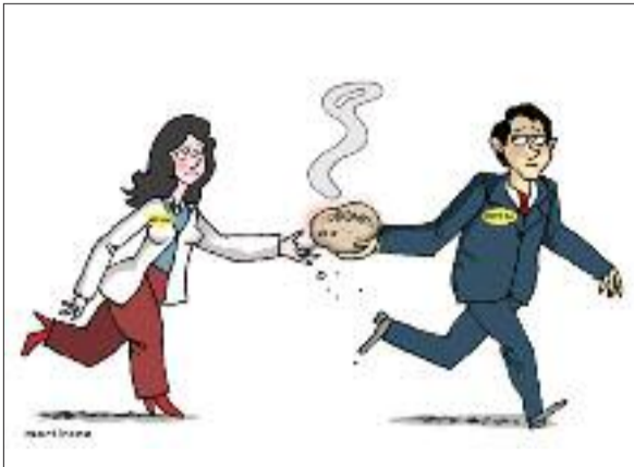
Arrimadas, a heroína de Cidadáns