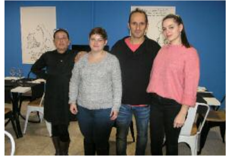
Persoal de Novas Conchas.

N ovas Conchas abriu fai un mese na rúa Velázquez do barrio ourensá do Couto. Ofrece menús diarios e de fin de semana. Tamén prepara pratos especiais por encargo para grupos. Xa oferta o menú de