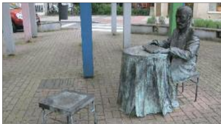
Estatua sedente de Manuel María en Monforte de Lemos.