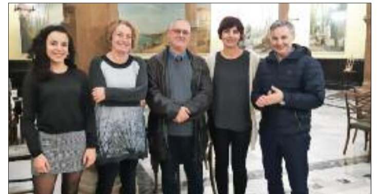
Membros do xurado.