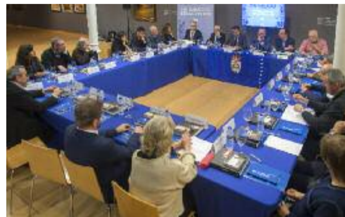
Xuntanza plenaria para coordinar as actividades.

Un xunta plenaria está a coordinar as actividades que se celebrarán para conmemorar o centenario da Xeración Nós, no ano 2020, e na que tamén participan representantes de diversas administracións e entidades culturais galegas.