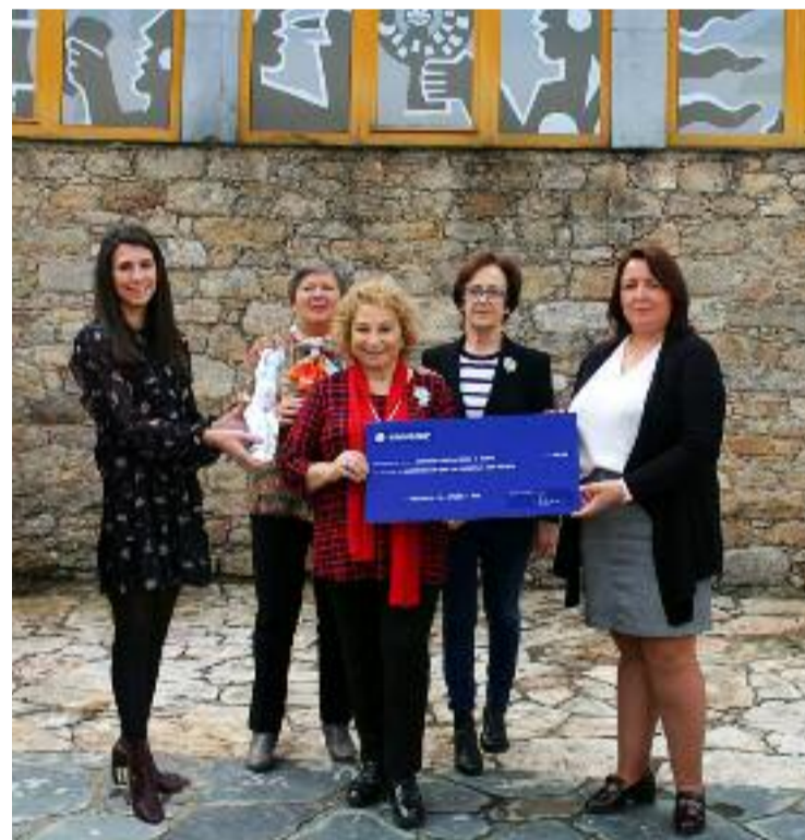
Simbólica recollida dos cartos da poxa.

a acollida da iniciativa e poñen de manifesto que non será un acto illado, xa están a pensar en facer algunha outra iniciativa de fronte ao próximo ano para colaborar coa Asociación