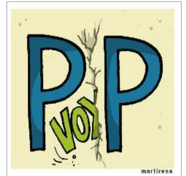
El Gran Wyoming: VOX é unha escisión do P.P.