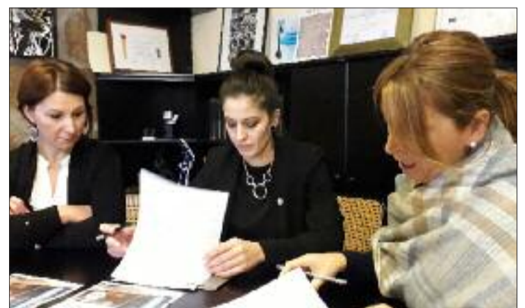
Sinatura do convenio.

Para poder gozar deste servizo é preciso contactar co Oca Vila de Allariz Hotel & SPA para reservar cita previa (recoméndase, mínimo, 48 horas de antelación) e aportar o carné de cidadanía. O Concello