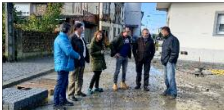
A Xunta dotará de servizos a Pobra de Brollón.

Nesta área créase unha pequena praza na que se proxecta un motivo central a base da