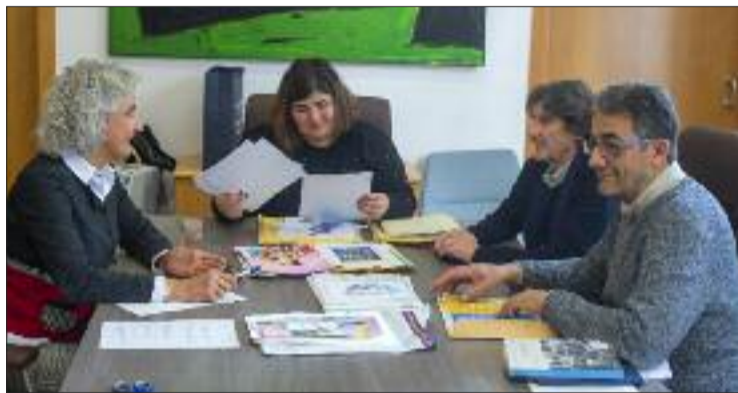
O xurado reunido no centro cultural Marcos Valcarcel.