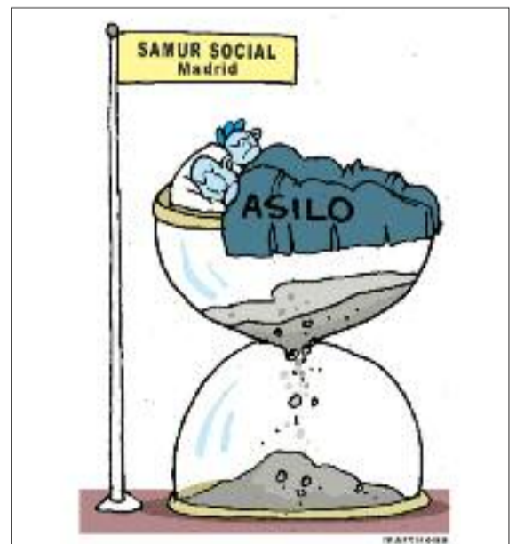
Familias con nenos fronte ao Samur Social de Madrid