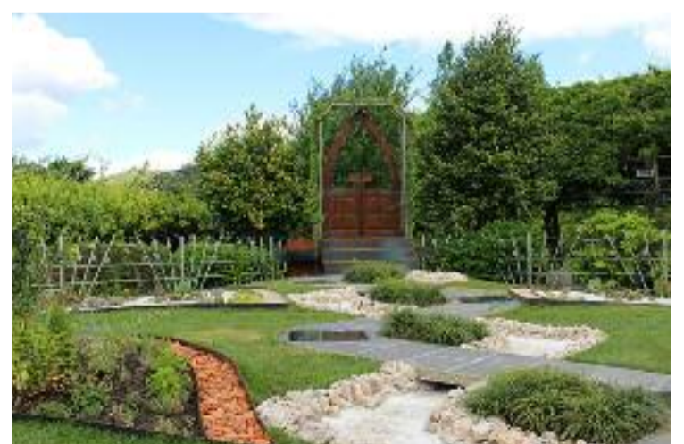
Xardín "Vertixe reversible".

cultura oriental con notas da cultura portuguesa. Este xardín está destinado a mellorar as relacións entre Portugal e China, recoñecendo o seu valor histórico e cultural. Dáse un alivio tamén para o valor dos portugueses na navegación por mares descoñecidos e coñecer a outras persoas e tamén para a fusión coas tradicións chinesas. Cada elemento contemplado neste xardín ten un significado histórico e cultural para o macanese, chinés e portugués.