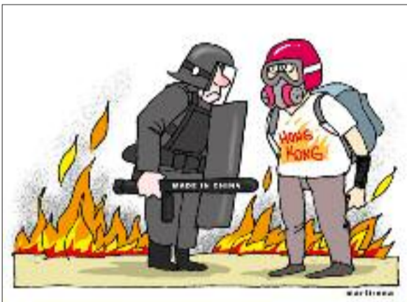
Hong Kong convertido nun campo de batalla