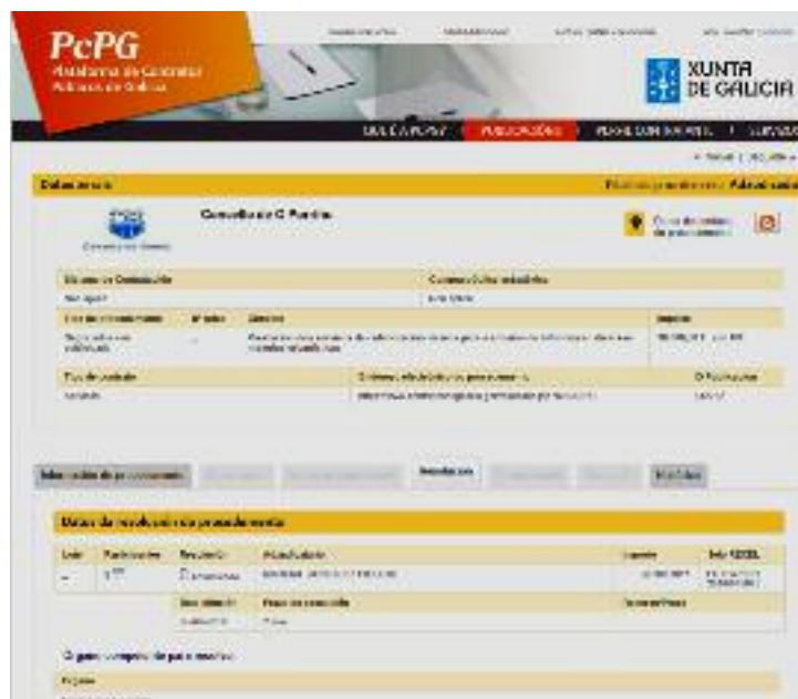
Web Contratos Públicos de Galicia cos datos do procedemento de contrato

Á vista disto, a realidade é que o xornalista "podendo ter acceso á totalidade do expediente, preferiu non contrastar a información e imputar ao Goberno local a comisión dun delito doloso, saltándose a verdade e sabendo que o facía", subliña Eva García de la Torre quen engade, que a intencionalidade desta calumnia é aínda máis evidente considerando que este 'informador' decidiu publicar este artigo "a pesares de que posto en contacto telefónico comigo expliqueille polo miúdo, e paso a paso, todo o procedemento".